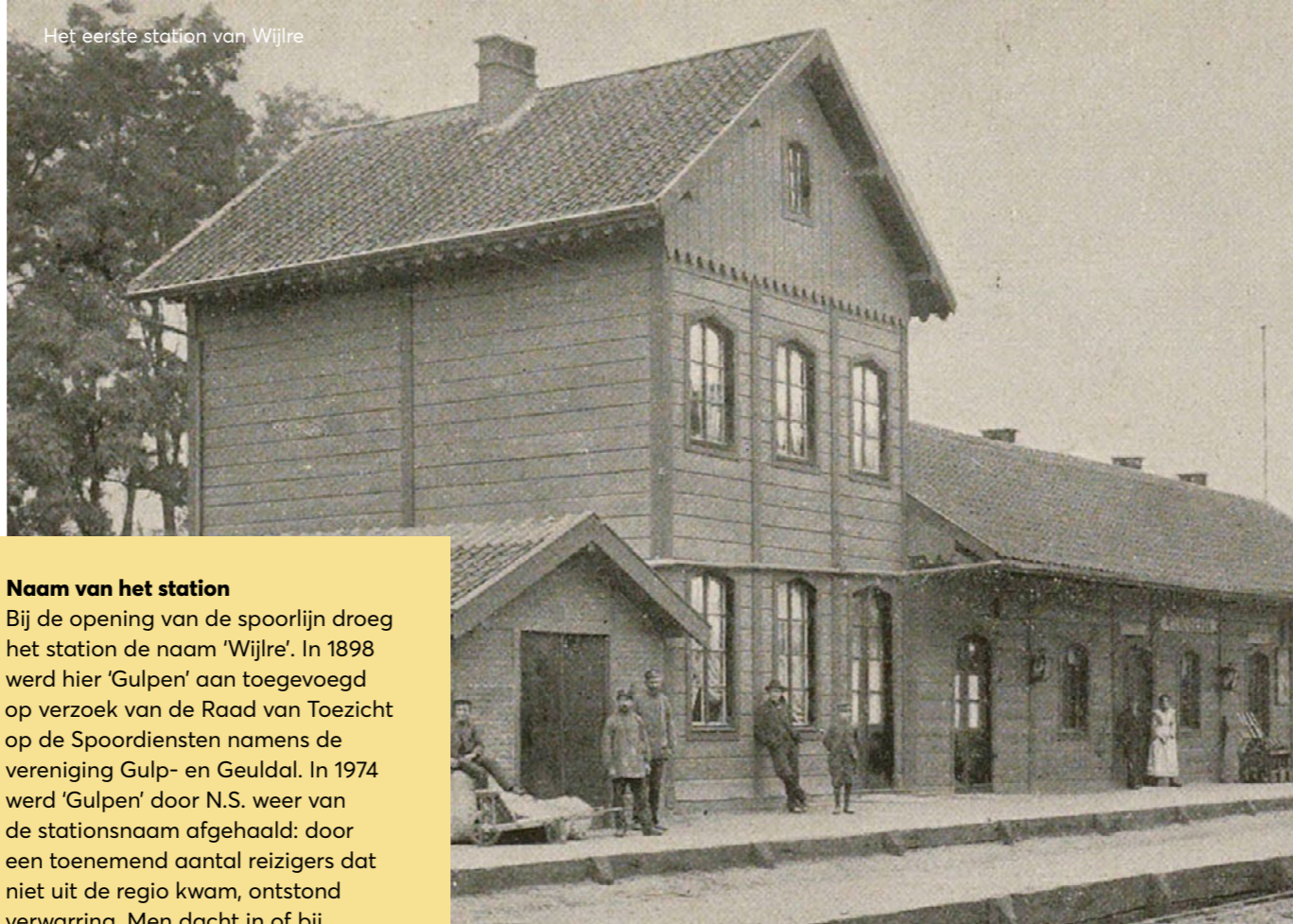
Het eerste station van Wijlre